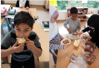
Op naar een gezonde(re) school!

Week van de pauzehap Van 25 t/m 29 September doet de Ayoub mee aan de "week van de pauzehap", oftewel "ik eet het beter". Tijdens deze week willen wij kinderen aanzetten tot een gezondere eetstijl. Wij hopen dat de kinderen op deze manier, door te ervaren, leren hoe lekker en leuk het is om gezond te kiezen.